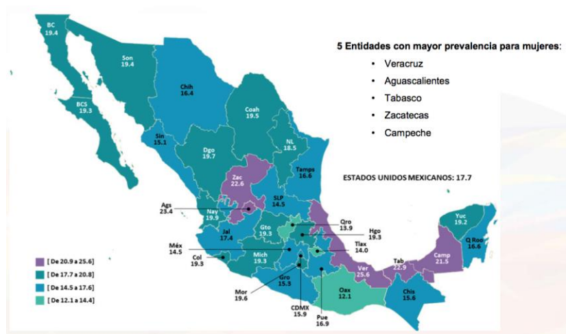
Tabla 4: Porcentaje de mujeres de 12 a 59 años de edad, que vivió ciberacoso en los últimos doce meses, por entidad federativa.

XII.- Cabe señalar que este estudio identifica como ciberacoso como aquel acto intencionado, ya sea por parte de un individuo o un grupo, teniendo como fin el dañar o molestar a una persona mediante el uso de Tecnologías de la Información y la Comunicación (TIC), en específico el Internet o teléfono celular.