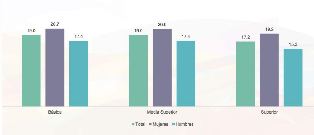
Tabla 3: Porcentaje de la población de 12 a 59 años de edad, que vivió ciberacoso durante los últimos doce meses, por nivel de escolaridad según sexo.

básico que comprende los niveles preescolar, primaria y secundaria.